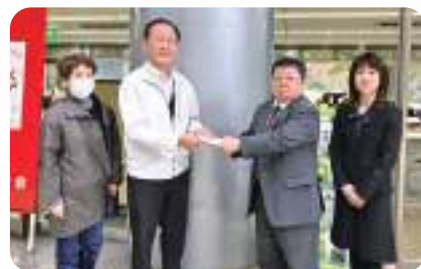
善通寺シバオケ同好会 様