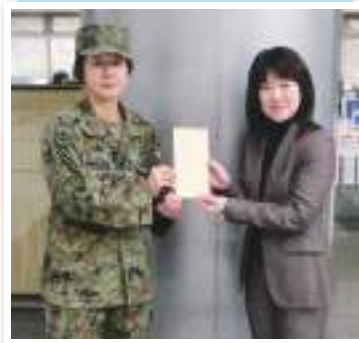
陸上自衛隊 善通寺駐屯地 様