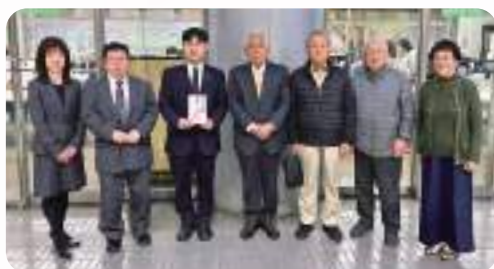
さぬき東京大衆歌謡楽団を楽しむ会 様