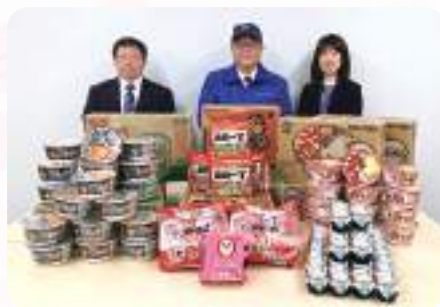
善通寺ライオンズクラブ 様